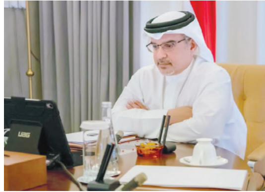
تراء صاحب السمو الملكي الأمير سلمان بن حمد آل خليفة ولي العهد نائب القائد الأعلى التعامل مع فيروس كورونا «كوفيد19» وما النائب الأول لرئيس مجلس الوزراء اجتماع اللجنة التنسيقية رقم 307 والذي عقد لأول مرة عن بُعد، وخصص لبحث آخر مستجدات