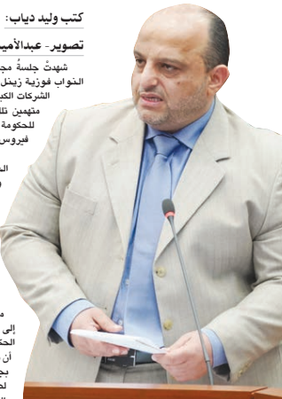
كتب وليد دياب: تصوير - عبدالأمير السلاطنة شهدت جلسة مجلس النواب أمس برئاسة رئيسة مجلس النواب فوزية زيميل، جويوتا عنيفا من قبل بعض النواب على الشركات الكبرى والبنوك وكبار التجار بمطلة البحرين. متهمين تلك الجهات بعدم مشاركتهم في تقديم الدعم للحكومة والشعب البحريني في ظل تداعيات أزمة فيروس كورونا.

كبار التجار من الحزمة المالية التي أعلنت عنها الحكومة مؤخرا. من جانبه قال النائب علي إسحاق: «إن المحن والشدائد تبيّن معدن الرجال، واليوم نرى شعب البحرين يقطع في هذه المحنة وينتظر من الشركات أداء دورهم المجتمعي، مضيفا أننا نرى التجار في دول أخرى يقدمون التبرعات الكبيرة في هذه الأزمة التي تواجه العالم وهناك العديد من المبادرات من كبار التجار والياضيين والقائمين في دول أخرى لتقديم الدعم، لافتا إلى أن في البحرين نرى التجار يكتفون بمطالبة الحكومة بدفع تعويضات لهم، واصفا خطاب غرفة التجارة بشأن إعفاء إيجارات المحال بالخجل، مطالبا النواب بالموافقة على التبرع بربع رواتبهم لصالح الصندوق.