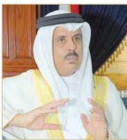
وزير التربية والتعليم

عن يحد مع أولياء أمور هذه الفئات من الطلبة، في الفترة القليلة الماضية، بما في ذلك التواصل إلكترونياً عبر التطبيق الرقمي (كلاس دوجو)، وغير الواسب والأتصال الهاتفي، 544 مرة لفئة اضطراب التوحد، و73 مرة لفئة الإعاقة الذهنية البسيطة ومتلازمة داون. وأكد أن الوزارة قد حرصت على إشراك الطلبة ذوي الاحتياجات الخاصة في هذه الفترة تركز على استيراد السلع الأساسية الغذائية والمواد والإغاثة، لأنه لا يوجد بعض المواد المهمة التي لها دور في تحلية المياه وتوليد الطاقة لها أولوية أسوة بالمواد الأساسية، لا سيما في الدول التي تقوم باستيراد مثل تلك المواد.