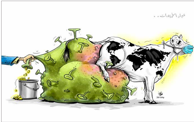
كاركاتير: هاني الممل البلاد

الوضع الراهن يتطلب وعياً في التعامل ومسؤولية وطنية يضطلع بها المواطن قبل كل شيء، وأثبت المواطن البحريني مهارته في التعامل مع مختلف الظروف وكان سندا وعضداً وأداة فاعلة لحكومته، كيف