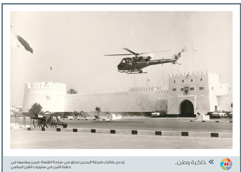
إحدى طائرات شرطة البحرين تطلق في «ساحة القاعة» ضمن مهامها في حفظ الأمن في ستينيات القرن الماضي