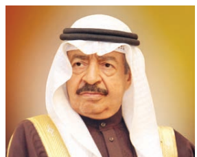
○ سمو رئيس الوزراء