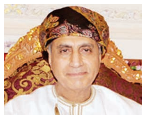
○ سمو نائب رئيس الوزراء العماني

بعثت حضرة صاحب الجلالة الملك حمد بن عيسى آل خليفة عاهل البلاد المفدى برفيقة تهنئة إلى فخامة السيدة إيكاتريني ساكالا رئيسة يونانية جمهورية اليونان، وذلك بمناسبة ذكرى استقلال بلادها.