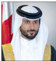
سمو الشيخ ناصر بن حمد

المفدى وأن يسد على طريق الخير خطاه وأن يجزيه على ذلك خير جزاء. من جانبه، قال الدكتور مصطفى السيد الأمين العام للمؤسسة الملكية للأعمال الإنسانية بأن هذا الاسم ليس بالقرب على جلالته الملك المفدى فهو ملك الإنسانية من خلال رعايته الأبوية واهتمامه الكبير بالآيات والأعمال والاحتياجات داخل البلد وفي مختلف دول العالم. وبيّن د. السيد بأن هذا التحول الاستراتيجي الذي تشهده المؤسسة يأتي نتيجة للاهتمام الكبير والدعم اللا محدود الذي تحظى به المؤسسة من قبل جلالته الملك المفدى والحكومة الرشيدة بقيادة صاحب السمو الملكي الأمير خليفة بن سلمان آل خليفة رئيس الوزراء، ومؤازرة صاحب السمو الملكي الأمير سلمان بن حمد آل خليفة ولي العهد الأمين النائب الأول لرئيس مجلس الوزراء، وجهود سمو الشيخ ناصر بن حمد آل خليفة ممثل جلالته الملك المفدى في تقديم العمل وفق الرؤية الحكيمة لجلالته لتكون المؤسسة الملكية للأعمال الإنسانية رائدة وسباقة في تقديم المبادرات والمساعدة للجميع وفق رؤية وتطلعات جلالته ولتكون اليد البيضاء لجلالة الملك المفدى حفظه الله ورعاه المنة بالخير دائماً للجميع داخل وخارج البلاد، سائلاً المولى عز وجل أن يوفق جلالته الملك