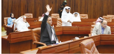
الجلسة شهدت انقساماً بين النواب على دور التجار في مواجهة أزمة كورونا، الأخرى، منتقدين انتقاداً تجار توبيخات لهم فقط على حذفهم، أن التجار يباروا منذ أول يوم البحرين بمطالبة الحكومة برفع في حين أكد نواب آخرون للأزمة وطالبوا من الحكومة تقديم

خدماتهم، وأن الحكومة طلت منهم التبرع إلى حين تنفيذ بعض الأمور، لافتين إلى أنه لا يمكن ضمان دور كبار التجار في العديد من الأعمال التي مرت ووقوفهم بجانب البحرينيين. وأحال النواب إلى الحكومة اقتراحاً مستجلاً بحظر التجول الجزئي في جميع أنحاء مملكة البحرين، من المناطق السياحية مساهمة حتى المساعدة الخامسة صباحاً، مع استثناء من يستدعي عمله، كما طالبوا بصراف مساواة تشجيعية للموظفين ومكافأة خاصة للموظفين. ولكنها المعاملة ضمن الحملة الوظيفية لمكافحة فيروس كورونا، والعاملين في الصوف الأمامية. (التفاصيل ص٨)