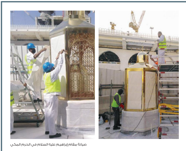
صيانة مقام إبراهيم عليه السلام في الحرم المكي

تشهد درجات الحرارة ارتفاعاً ابتداءً من الأربعاء وظهر غد الخميس، مع بقاء الأجواء لطيفة ضمن المعدلات الحالية مساءً، ومن المتوقع أن تنشط الرياح الجنوبية الشرقية ابتداءً من مساء الخميس وتشتد مساء السبت مع فرص لهطول أمطار مساء السبت وصباح الأحد المقبل.