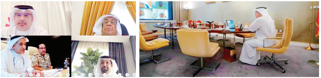
○ سمو ولي العهد يتأسس أول اجتماع عن بعد للجنة التنسيقية.