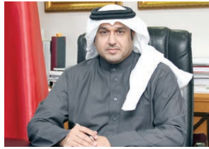
القاضي علي أحمد الكعبي

في ظل المستجدات الراهنة لأجواء فيروس كورونا (كوفيد-19) بالأساس الاحترازية