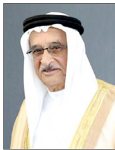
الشيخ محمد بن عبدالله آل خليفة

وقال رئيس المجلس الأعلى للصحة إن مملكة البحرين استخدمت «الهيدروكسي كلوركين» في 26 فبراير 2020 وذلك بعد اكتشاف أول حالة قائمة للفيروس بمملكة البحرين في 24 فبراير، وأشار إلى أن الفريق الوطني الطبي للتصدي لفيروس كورونا «كوفيد 19» قرّر استخدام الدواء