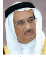
رئيس المجلس الأعلى للصحة

أكد الفريق طبيب الشيخ محمد بن عبد الله آل خليفة رئيس المجلس الأعلى للصحة رئيس الفريق الوطني الطبي للتصدي لفيروس كورونا (COVID-19) أن البروتوكول العلاجي لمرضى الفيروس المستجد باستخدام بروتوكول العلاج الطبي للبحريني أثبت فاعليته في تعافي عدد من الحالات القائمة للفيروس في مملكة البحرين، إذ تعد البحرين من أوائل الدول على مستوى العالم التي استخدمت هذا البروتوكول، مشيراً إلى أن الدواء حقق نجاحاً كبيراً بعدما تمت تجربته واستطاع تقليل نسبة الفيروس وأسهم في انتعاش أعراضه والحد من مضاعفاته.