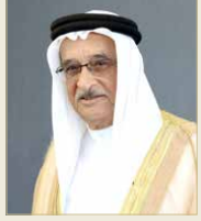
الشيخ محمد بن عبدالله

كعلاج أساسي لعلاج الملاريا، كما يستخدم حالياً في مرض التهاب المفاصل والذئبة الحمراء، وأثبتت فاعليته بعدما طبق على الذين لديهم حالات صحية خاصة مثل وجود أعراض الفيروس أو التهاب رئوي أو عوامل خطورة، حيث إن الاستجابة المناعية الطبيعية مسؤولة عن التهابات المفاصل الروماتويدي، والذي أظهر الـهيدروكسي كلوروكين -التغلب عليها، ميثا أن تطبيق بروتوكول العلاج يعتمد على الحالة المرضية.