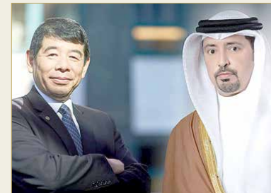
البحرين سبقة بتعزيز أقسام النقل السريع من خلال زيادة أعداد الموظفين؛ نظراً لزيادة الطلب والبريد الإلكتروني.

عن طريق التجارة الإلكترونية، منوها إلى أنه فيما يتعلق بموضوع الاستيراد، فإن غالبية الدول خلال هذه الفترة تركز على استيراد السلع الأساسية الغذائية والمواد والإغاثة، لأنه لا يوجد بعض المواد المهمة التي لها دور في تحلية المياه وتوليد الطاقة لها أولوية أسوة بالمواد الأساسية، لا سيما في الدول التي تقوم باستيراد مثل تلك المواد. وفي الختام، أثنى الأمين العام لمنظمة الجمارك العالمية على الإجراءات الاستثنائية التي قامت بها مملكة البحرين ودول الخليج، وهو ما يتضح من خلال الأرقام التي تعكس السيطرة على خطر كورونا.