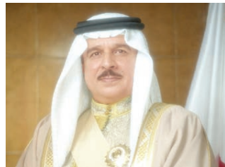
○ جلالة الملك