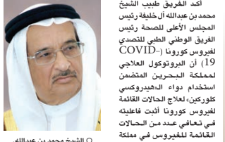
الشيخ محمد بن عبدالله آل خليفة رئيس المجلس الأعلى للصحة

يثبت فاعليته في تعافي المصابين بـ «كورونا» أكد الفريق الطبي الشيخ محمد بن عبدالله آل خليفة رئيس المجلس الأعلى للصحة رئيس الفريق الوطني الطبي للتعامل مع COVID-19 أن البروتوكول العلاجي لمملكة البحرين المعتمد استخدام دواء الهيدروكسي كلوروكين، لعلاج الحالات الفعالة لفيروس كورونا أثبت فاعليته في تعافي عدد من الحالات الفعالة للفيروس في مملكة البحرين إذ تعد البحرين من أوائل الدول على مستوى العالم التي استخدمت هذا الدواء، والتي استخدمت هذا الدواء مشيراً إلى أن الدواء حقق نجاحاً كبيراً بعدما تمت تجربته في صفوف الانتظار والحرص على ترك مسافة (لا تقل عن متر) في مراكز التسوق وأماكن الخدمات العامة وتقاط الانتظار. توصيل الطعام من وإلى موقع عمله على تيسر المثال، والاستفادة من أنظمة طلب الاحتياجات والمشتريات المنزلية عبر خدمات التوصيل إلى المنازل. (التفاصيل ص٢)