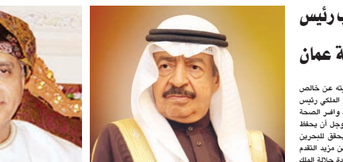
○ سمو رئيس الوزراء ○ سمو نائب رئيس الوزراء العماني

صدر عن حضرة صاحب الجلالة الملك حمد بن عيسى آل خليفة عاهل البلاد المفدى، أمر ملكي رقم ١٥ لسنة ٢٠٢٠ بإعادة تسمية المؤسسة الخيرية الملكية، وجاء في المادة الأولى من الأمر الملكي أنه تُعاد